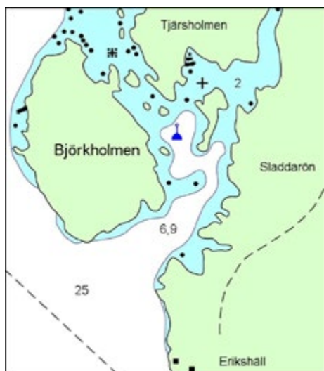
Sladdarön N 60° 16',764 E 18°36',092 Bsp Stockholm norra sid. 15

Skulle du vilja hjälpa till i kretsens arbete med att finna lämpliga lägen för nya bojor och se till att de kommer på plats? Hör gärna av dig till kretsstyrelsen eller kretsens hamn- och farledskommitté. Vi söker framförallt dig som sommartid vistas i farvattnen längs kuststräckan Arholma – Örskär.