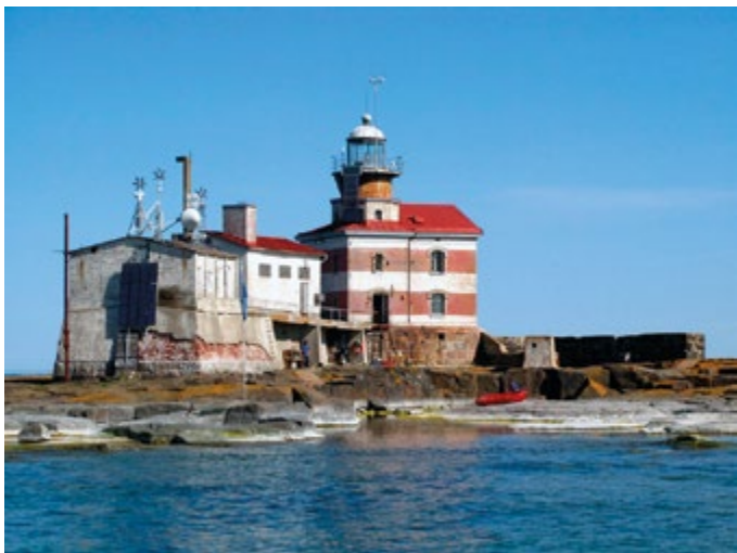
Märkets fyr.

I början av juni, preliminärt på pingstafton den 3 juni, arrangerar kretsen i samarbete med Fyrsällskapet en utfärd till Märket . Detaljer och definitiva tider samt kostnader etc kommer att meddelas via vår hemsida så snart detta är klart.