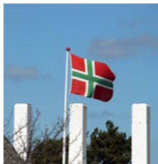
Bornholms flagga är röd-vit-grön.