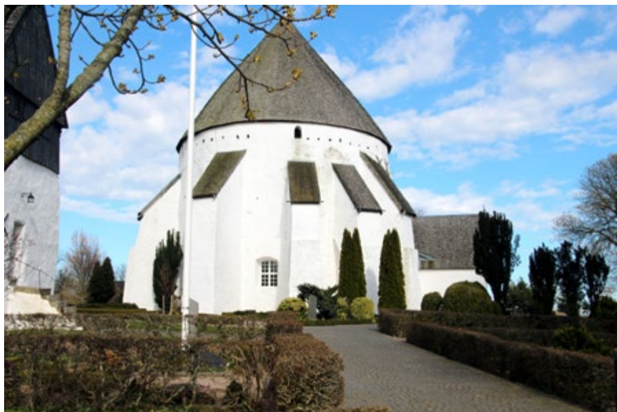
Till Bornholms historiska sevärdheter hör de fascinerande rundkyrkorna.